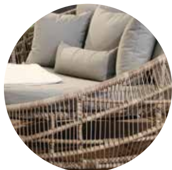
Detalles de base