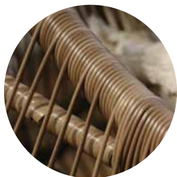
Tejido en Fibra Termoplástica