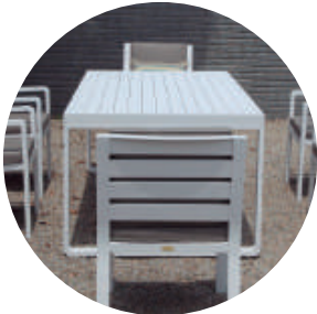
Detalles de comedor