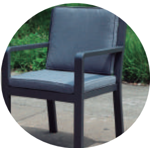
Detalle de silla negra