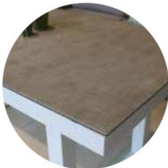
Mesa de Centro