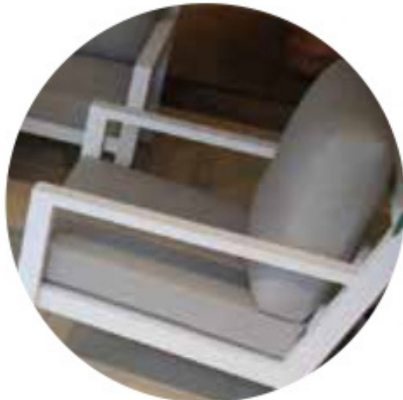
Detalle de Sofá Sencillo